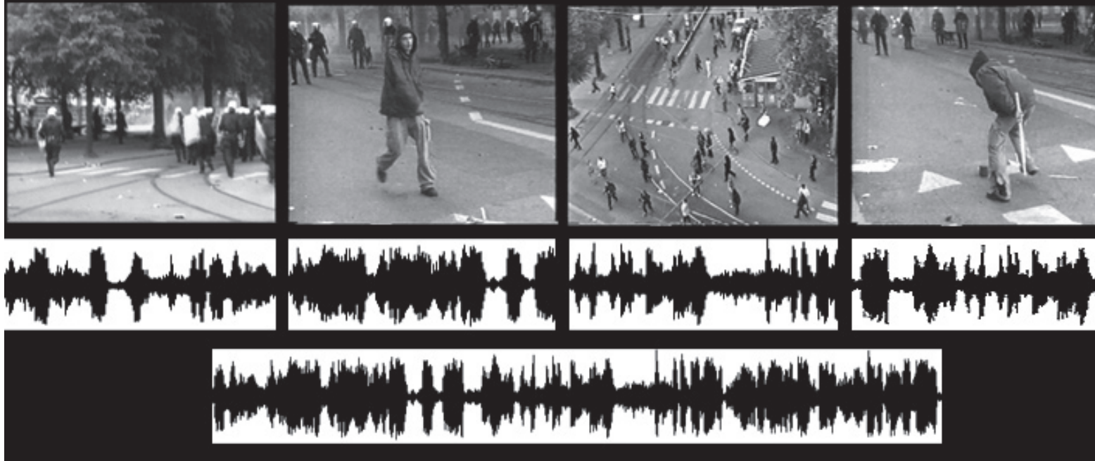
Metod med svartrutor för att urskilja pålagt ljud. Illustration: Erik Fabler