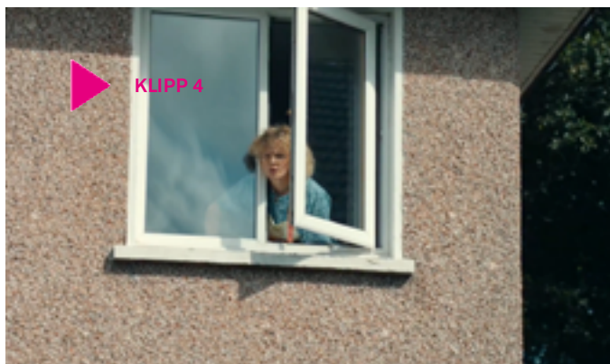
Klipp 4 Källa: Scanbox Entertainment

• Se klipp 4 . Diskutera vad ni tänker och tycker om skådespelarinsatserna. Vilka andra filmer har ni sett där en skådespelare gör en fin insats i att gestalta en funktionsvariation som hen inte själv har? Illustrera gärna för varandra med klipp från någon film ni sett.