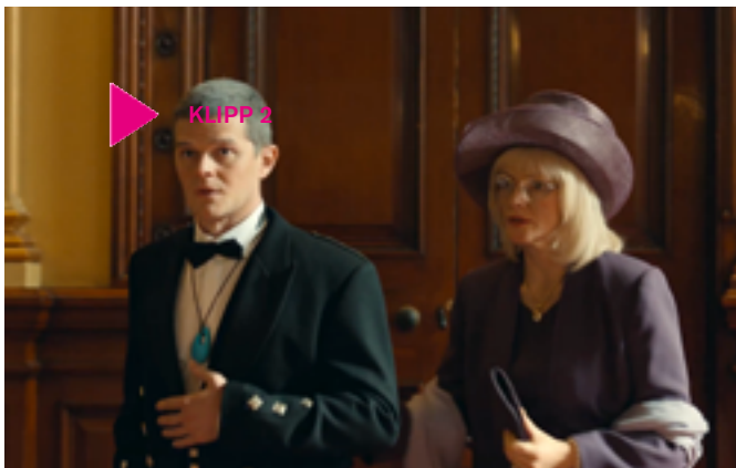
Klipp 2

hos sin egen mamma? Vilken betydelse tror ni att stöd från familj och annan omgivning har för hur mycket en individ med till exempel Tourette klarar av? Vilka personliga egenskaper hos John bidrar till att han utvecklas på det sätt han gör?