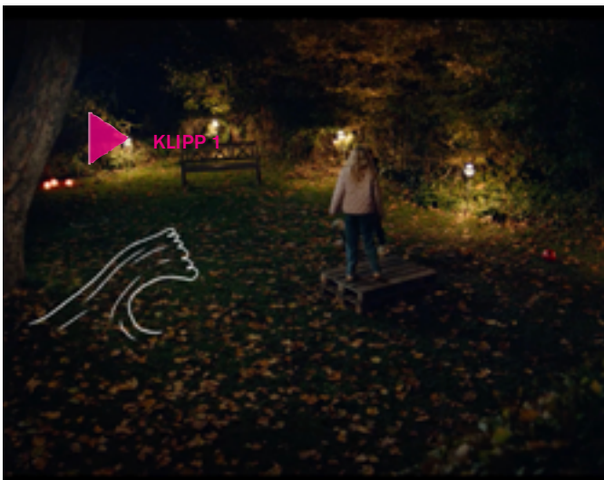
Klipp 1