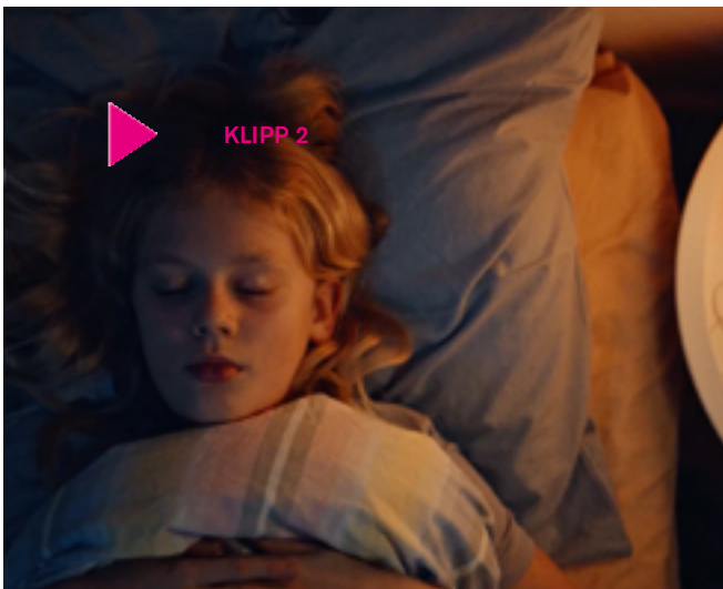
Klipp 2

vilka tekniker ni kan använda. Vad vill ni berätta med era skulpturer?