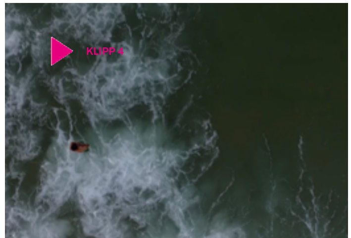
Klipp 4