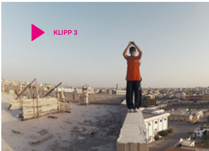
Klipp 3

• Fortsätt på det här temat genom att göra en hemuppgift där ni gör en kort intervju med era vuxna (till exempel en vårdnadshavare, någon av deras kompisar, en äldre släkting eller någon som jobbar på skolan). Vilka farhågor och förhoppningar hade de när de var i er ålder? Vilka saker har blivit bättre och vad har blivit sämre i samhället i stort, tycker de, jämfört med när de var yngre? Vilka mer personliga saker har blivit annorlunda (bättre eller sämre) än vad de hade tänkt sig? Spela in intervjun med telefon eller annan enhet och transkribera den sedan själv. Renskriv och lämna in skriftligt, redovisa sammanfattande muntligt för klassen. Alternativt använder ni ett AI-verktyg för själva transkriptionen och skriver sedan om intervjun till ett reportage utan att använda AI (instruktion för att skriva reportage finns sist i handledningen).